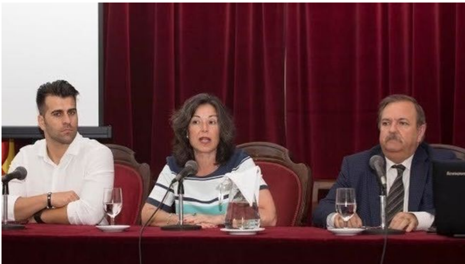
Diputación analiza los retos planteados para la sostenibilidad energética municipal CÁDIZ | EUROPA PRESS

Etiquetas ▶ Junta de Andalucía, Recursos Energéticos, Ahorro De Energía, Petróleo Y Gases Primarios, Economía (general).